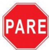
FIG. 1 (25 UNIDADES)

Modelos e quantidades de placas de sinalização de trânsito para os campi Anglo, Capão, Esef e Famed.