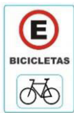
FIG. 6 (30 UNIDADES)