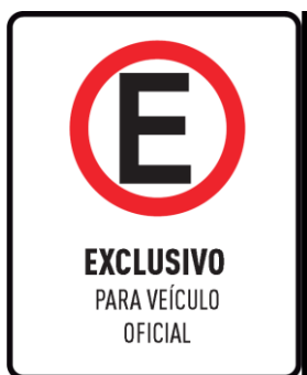
FIG. 19 (20 UNIDADES)