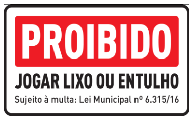
FIG. 30 (20 UNIDADES)