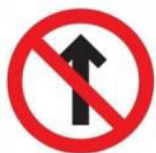
FIG. 12 (15 UNIDADES)