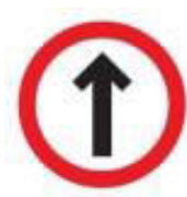
FIG. 11 (25 UNIDADES)