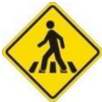
FIG. 27 (25 UNIDADES)