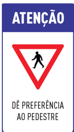
FIG. 24 (20 UNIDADES)