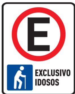
FIG. 21 (30 UNIDADES)