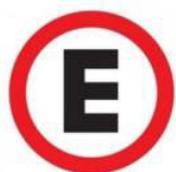
FIG. 8 (30 UNIDADES)