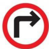
FIG. 18 (10 UNIDADES)