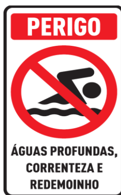
FIG. 29 (10 UNIDADES)