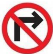
FIG. 13 (15 UNIDADES)