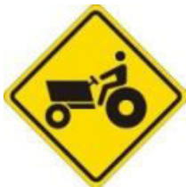
FIG. 26 (5 UNIDADES)