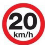
FIG. 3 (20 UNIDADES)