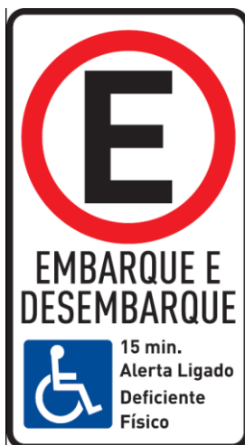
FIG. 23 (20 UNIDADES)