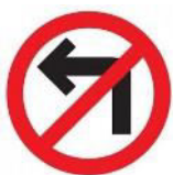
FIG. 14 (15 UNIDADES)