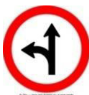
FIG. 16 (10 UNIDADES)