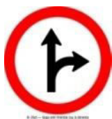
FIG. 15 (10 UNIDADES)