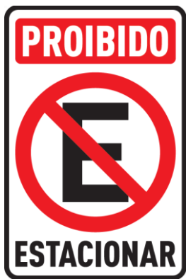
FIG. 22 (50 UNIDADES)