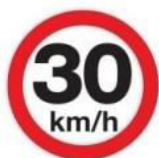
FIG. 2 (50 UNIDADES)