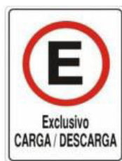
FIG. 4 (40 UNIDADES)