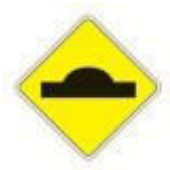
FIG. 25 (20 UNIDADES)