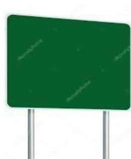
FIG. 32 (100 UNIDADES)