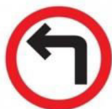
FIG. 17 (10 UNIDADES)