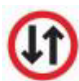
FIG. 10 (30 UNIDADES)