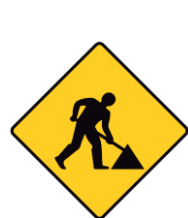
FIG. 28 (10 UNIDADES)