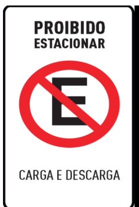
FIG. 20 (20 UNIDADES)