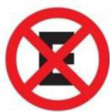
FIG. 9 (50 UNIDADES)